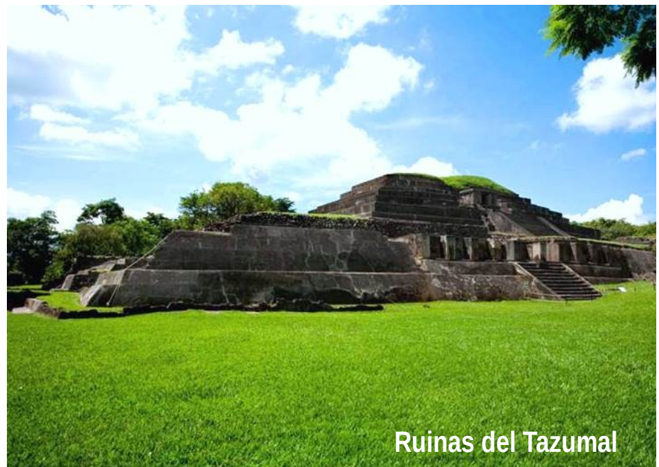
Ruinas del Tazumal