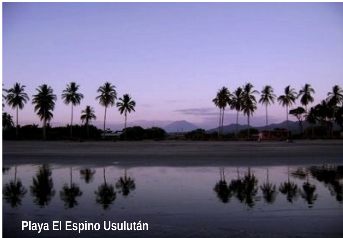
Playa El Espino Usulután